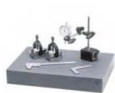
Suministrado sin herramientas de medida