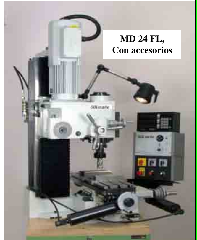
MD 24 FL, Con accesorios