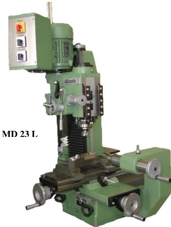
MD 23 L